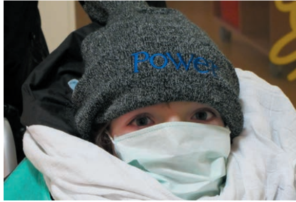
Hasta odasından bahçeye