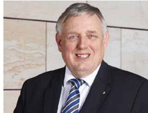
Karl-Josef Laumann, Minister für Arbeit, Gesundheit und Soziales des Landes Nordrhein-Westfalen

Heute ist das Kinderpalliativzentrum in Datteln Motor und wichtiger Kooperationspartner in der ambulanten und stationären Behandlung von Kindern und Jugendlichen in Nordrhein-Westfalen. Besonders hat mich gefreut, dass ich 2018 im Rahmen der Krankenhausinvestitionsförderung der Dattelner Klinik rund 6,5 Millionen Euro für den Erweiterungsbau für Kinderschmerztherapie und pädiatrische Palliativversorgung zusagen konnte.