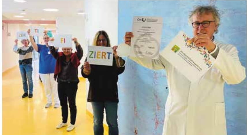
Große Freude: Als erste Pädiatrische Palliativstation von der DGP zertifiziert.

Andere stationäre Versorger sind die lokalen Krankenhäuser – auch wenn sie nicht spezialisiert sind in der Palliativversorgung von Kindern – stationäre Kinderhospize und Kurzzeitpflegeeinrichtungen, die Kinder zur Entlastung der Eltern geplant aufnehmen. Zuhause sind die Eltern die Hauptversorgenden. Sie werden unterstützt durch die/den niedergelassene/n Kinder- und